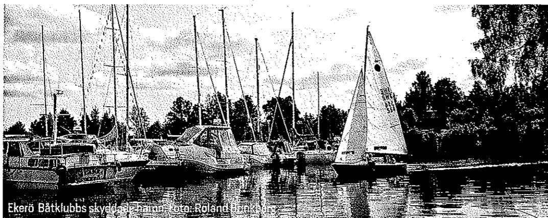
Ekerö Båtklubbs skyddad hamn.